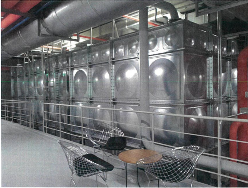
(6).PE 복합스테인리스 패널형 물탱크